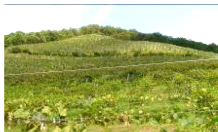
急勾配のブドウ畑

ココ・ファームの作り出すワインの、その味わいと品質の確かさ、作り手たちの高いこころざしは世界的にも高い評価を得ており、2000年の沖縄サミットでは公式晩餐会用のシャンパンとして、また洞爺湖サミットの総理夫人主催夕食会でも採用されています。