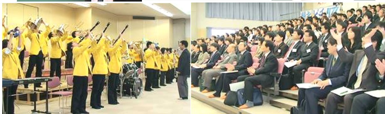
第3回全国模擬授業大会の様