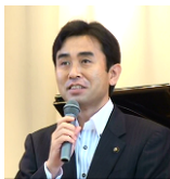
御来賓 大豆生田実 足利市長