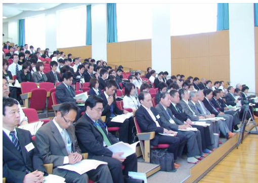
甲乙つけ難い授業に審査員の評価の目が光ります

本年度第4回を迎える「全国模擬授業大会」では、「チョーク一本の教育改革」を基本テーマに掲げ、全国各地の学習塾や予備校、公立・私立学校などから、授業者44名および審査員26名を含む約300名のご参加を賜りました。年々出場者が増え、それに伴いレベルも高くなってきており、この大会が多くの先生方が研鑽する場となってきましたことに心より感謝申し上げます。