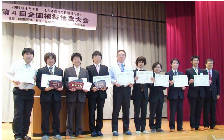
閉会式の様子(受賞者の皆さん)