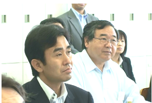
熱心に模擬授業に聴き入る 大豆生田市長