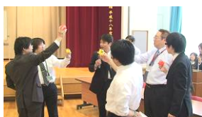
本選の順序を決めるくじ引き