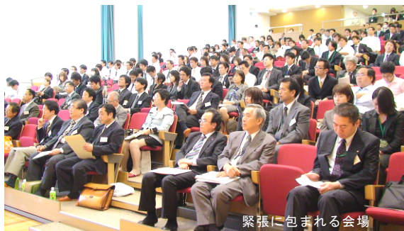
緊張に包まれる会場