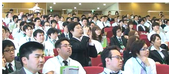
(右)本選授業に聴き入る参加者