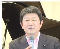
御来賓 茂木敏充 衆議院議員